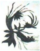
7. Fleurs 140.00