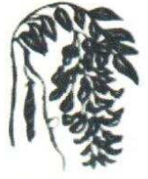
24. Glycine 120.00