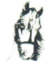
17. Cheval 120.00