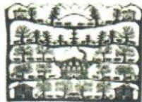
3. Poya 200.00