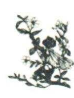
26. Enfant-Papillon 180.00