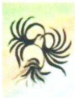
13. Oiseaux 140.00