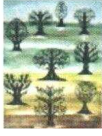
32. Arbres 150.00