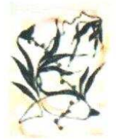
12. Fleurs 100.00