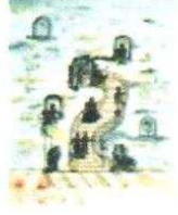
27. Bal 150.00