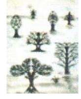
33. Arbres 150.00