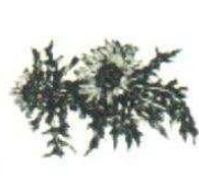
38. Chardon 120.00