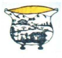
30. Chaudron 110.00