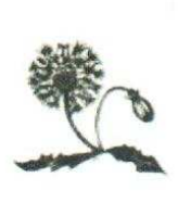
36. Pissenlit 80.00