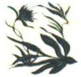
6. Fleurs 130.00