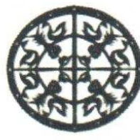
22. Ronde canards 120.00