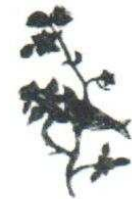
16. Oiseau/Branche 110.00