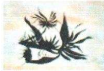
9. Fleurs 100.00