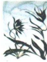
10. Fleurs 110.00