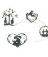
31. Chemin de vie 100.00