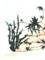
11. Fleurs 100.00