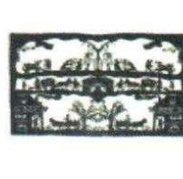
19. Vendanges 200.00