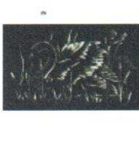
34. Cygne (nég.) 100.00