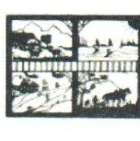
28. 4 Saison 110.00