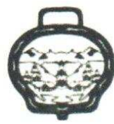
37. Cloche 90.00