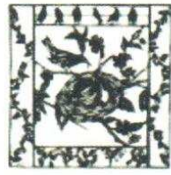
20. Oiseau Nid 140.00