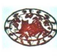
23. Chat brun 100.00