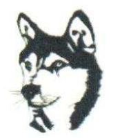
18. Chien 120.00