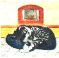
21. Chat dormant 170.00