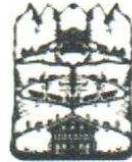
4. Poya 150.0