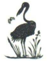
19. Héron 110.00