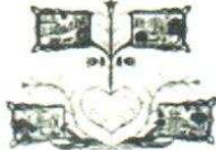
2. 4 Saisons 250.00