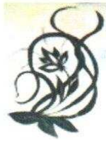
8. Fleurs 140.00