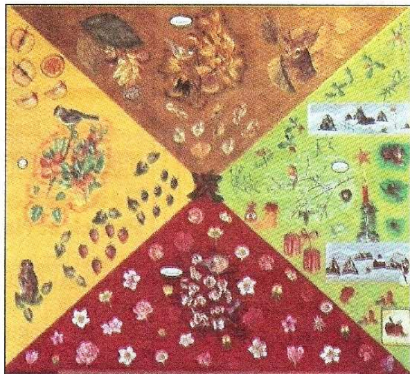
L'original: une des quatre saisons.